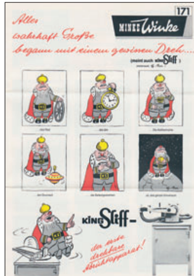
Der „KING SLIFF“ eine Universal- Schleifmaschine vorgestellt vom berühmten „STERN“-Karikaturisten G.Bri.