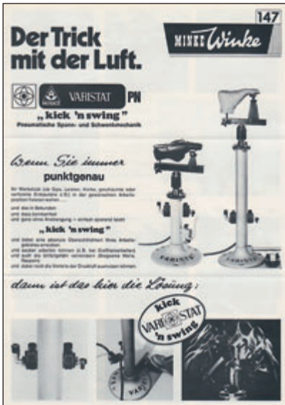
Im Bereich Arbeitsergonomie ganz vorn!! Auch heute noch in jeder Werkstatt gern gesehen: der VARISTAT Arbeitsständer mit Druckluftbedienung.