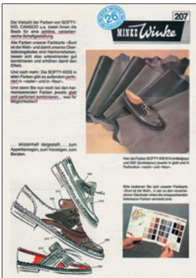
Auch im Bereich Oberleder hält die Farbe Einzug: Vorstellung der MINKE-Farbkarte „Bunt ist die Welt“.