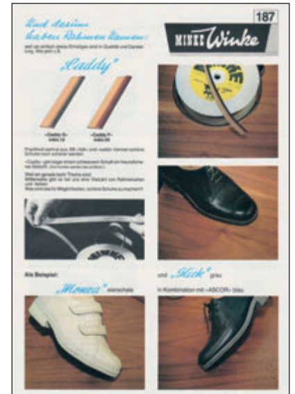
So langsam wird „Farbe“ Standard: eine neuer Rahmen aus dem „Stier auf Rollen“-Programm.