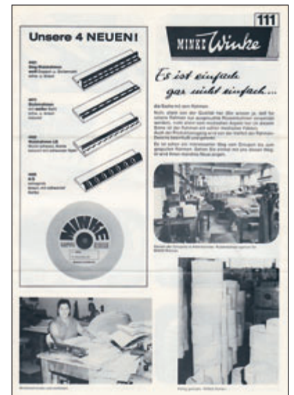
Das gab's vorher auch noch nicht: MINKE Lederrahmen platz sparend und gebrauchssympatisch auf Rollen!