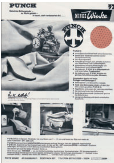
PUNCH mit Muster zum Kennenlernen.