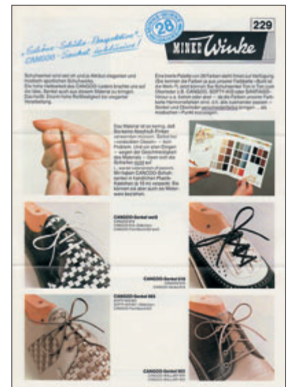
Und immer ein Herz für „Kleinigkeiten“: „Unkaputtbare“ Endlos-Schuhsenkel aus CANGO. Natürlich auch in 32 Farben.