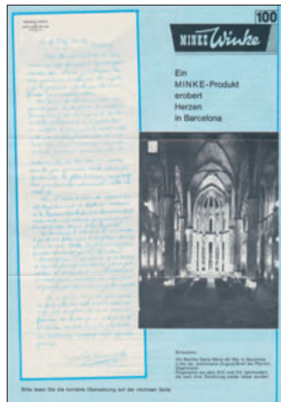
Der 100.!! Wieder zum Thema Lederweicher (Einsatz in der Restaurationswerkstatt einer Kathedrale in Barcelona).