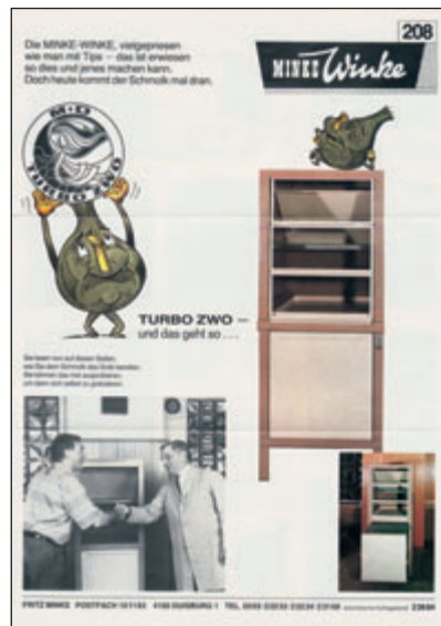
Und dieser Minke-Winke (Doppelseiter!!) wurde mit Hilfe des „SCHMOLK“ von vorne bis hinten in Reimform erstellt. Thema: TURBO ZWO – der Abluftschrank.